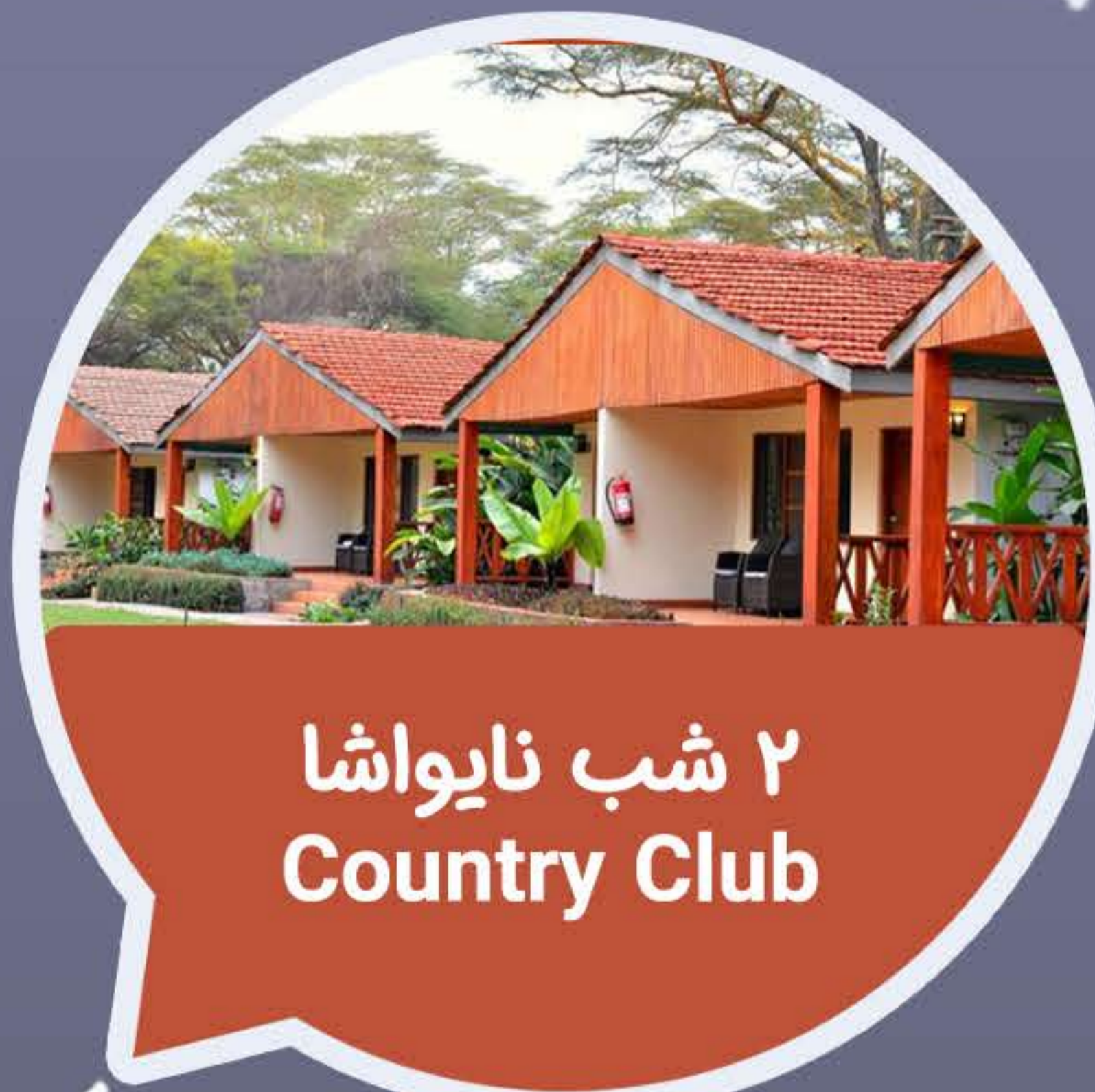
۲ شب نایواشا Country Club