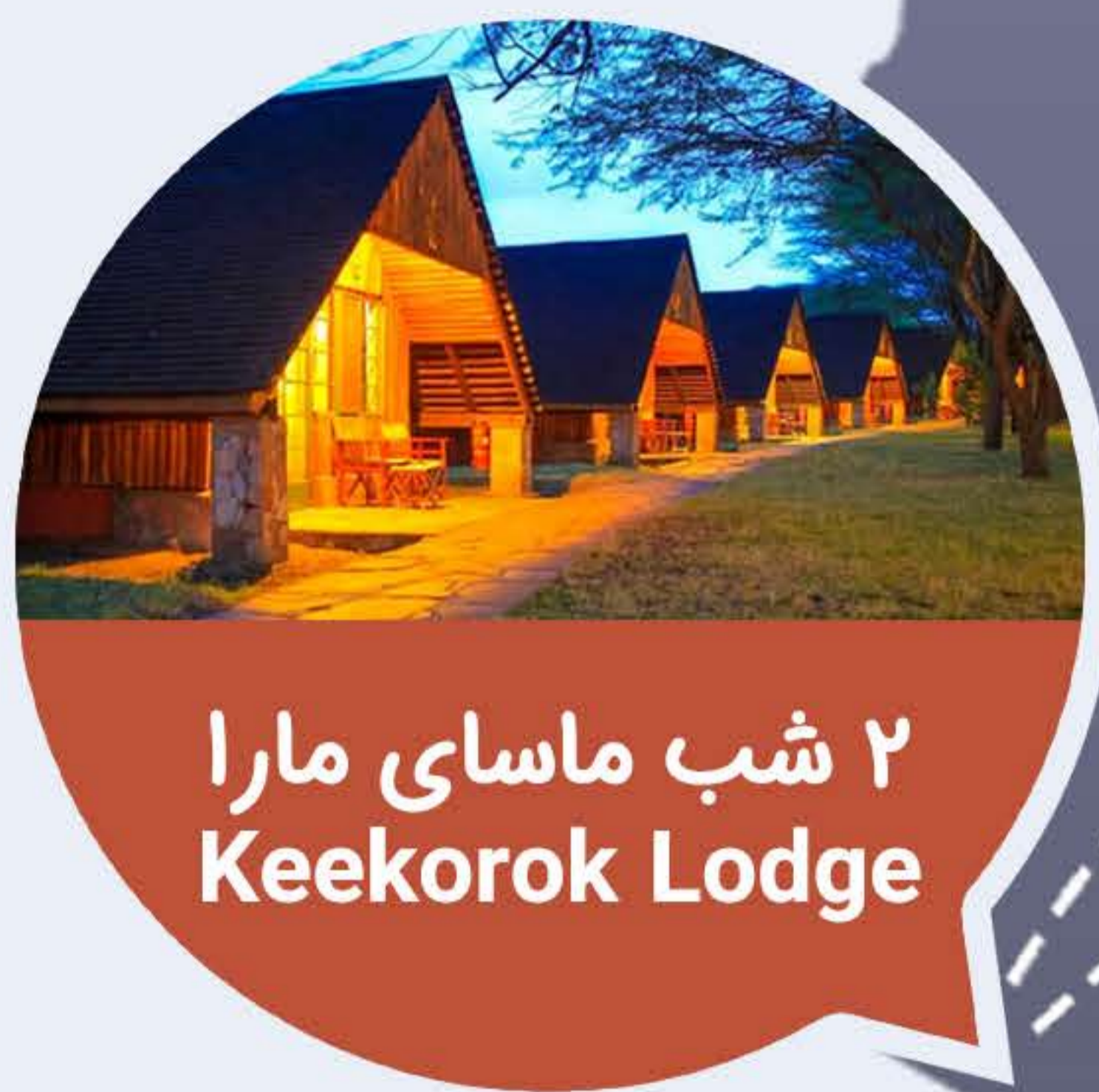
۲ شب ماسای مارا Keekorok Lodge