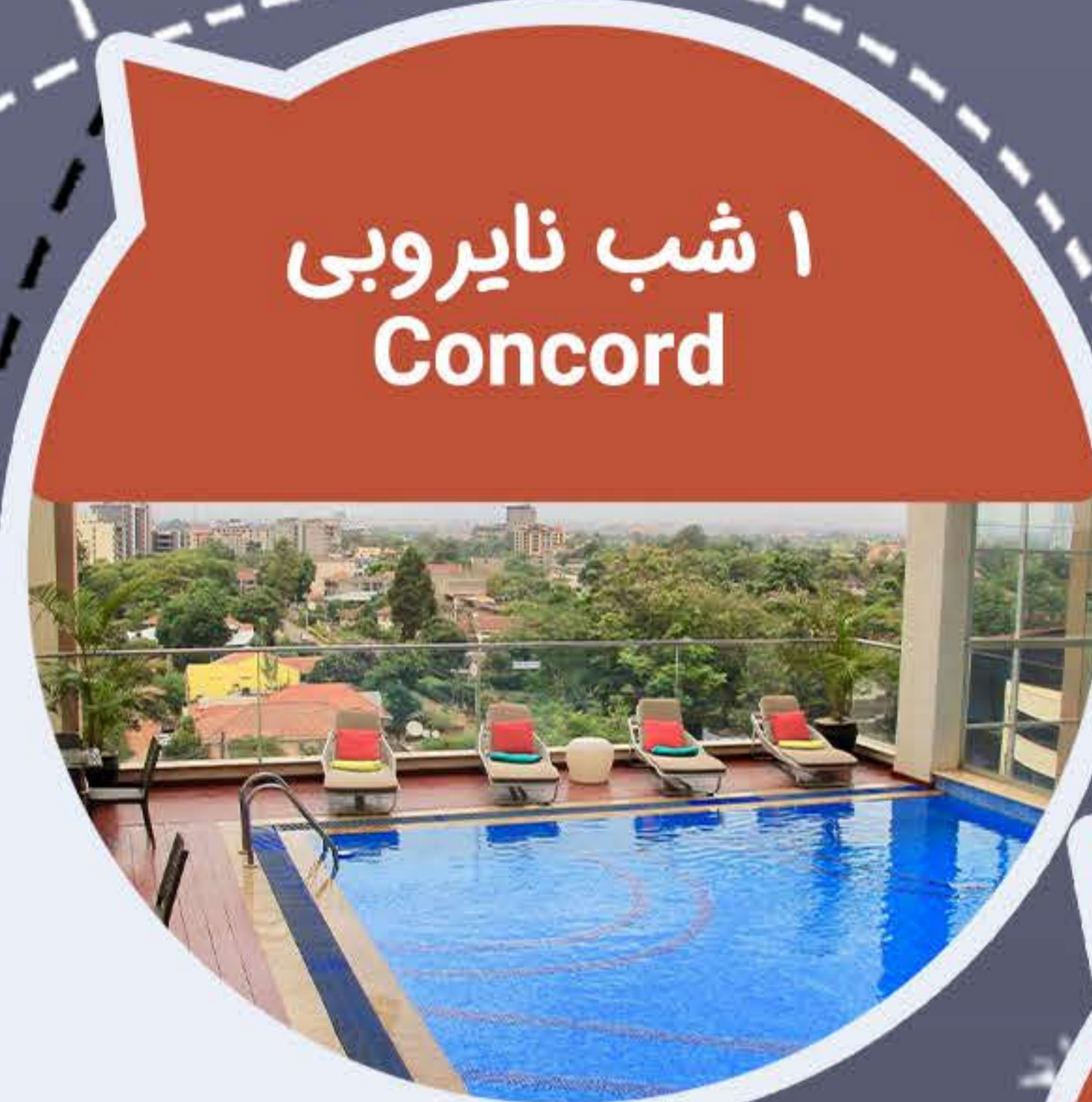
۱ شب نایروبی Concord