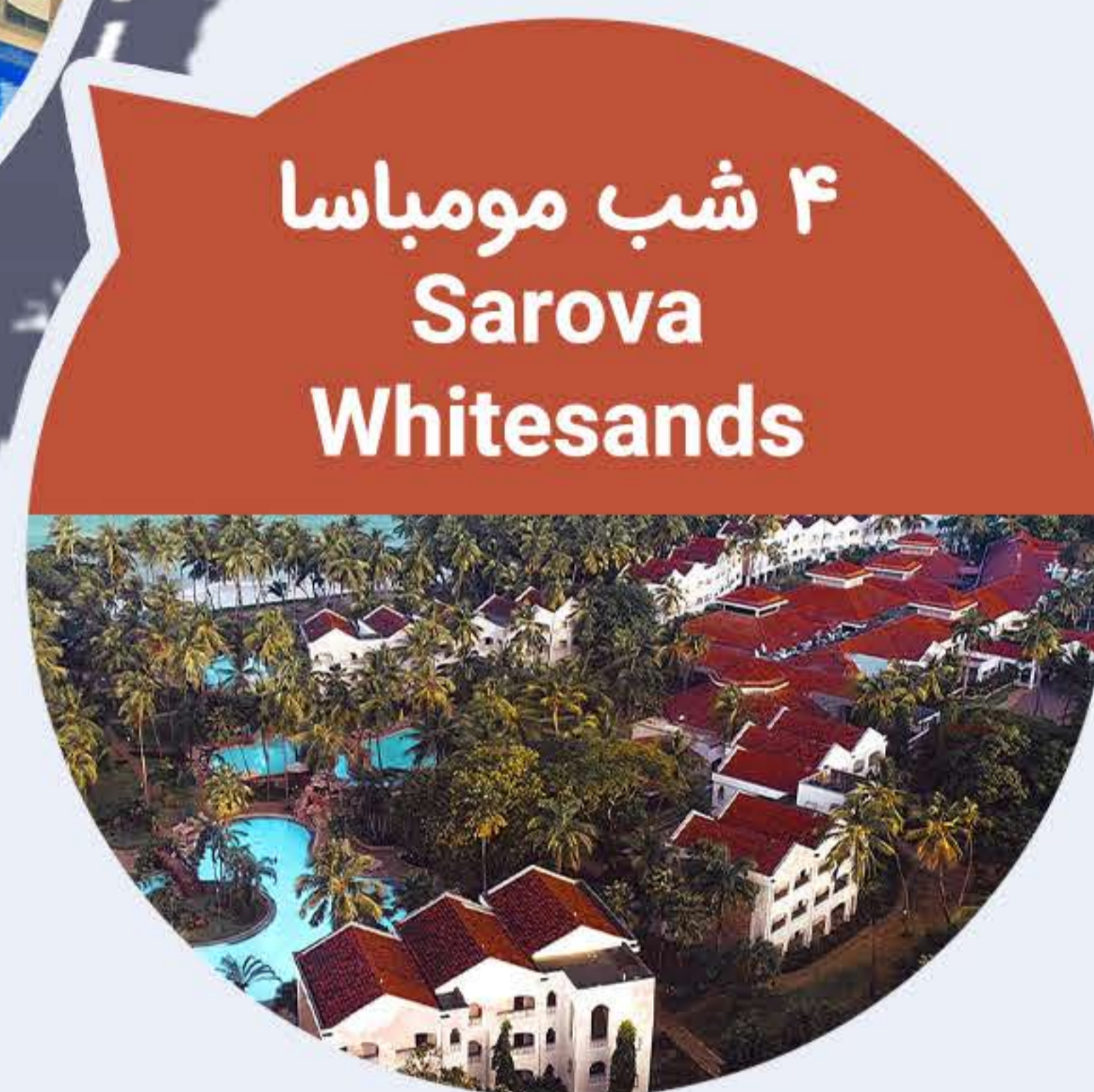
۴ شب مومباسا Sarova Whitesands